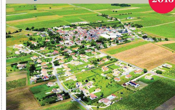
En quelques décennies, la population de Julienne a cru doucement.