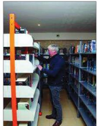
À terme seront regroupés autour de la mairie la bibliothèque, une salle des jeunes ou encore la salle des aînés.

L'esplanade de la mairie avec son musée de sculptures à ciel ouvert, des pièces issues de son Symposium. Le puits pigeonnier devenu l'emblème de la commune et quelques beaux porches et une fontaine.