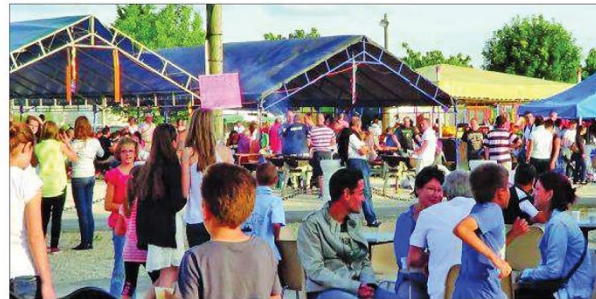
Av - Le marché de Noël, le marché de nuit est l'un des rendez-vous phare de la commune. Il attire chaque année près de 10.000 visiteurs.

Gilles BIOLLEY g.biolley@charentelibre.fr